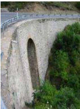
Vue de l'existant avant reprise du rayon