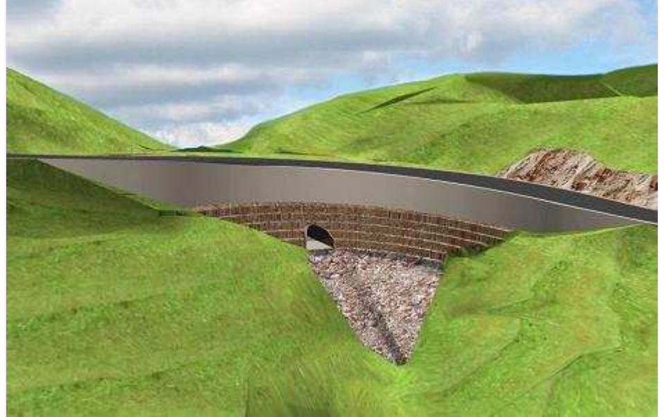
Société du Groupe MERLIN : INTERVIA Études