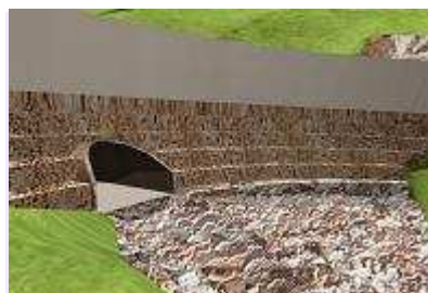
Reprise des passages hydrauliques