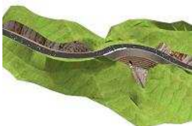
Élargissement d'ouvrage en relief difficile