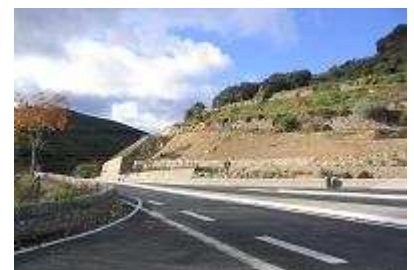
Insertion de créneaux en route de montagne