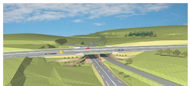
OA N° 11 Échangeur de Naucelle