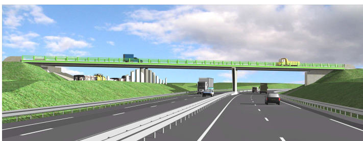
OA N°7 – Franchissement 2 x 2 v et VF