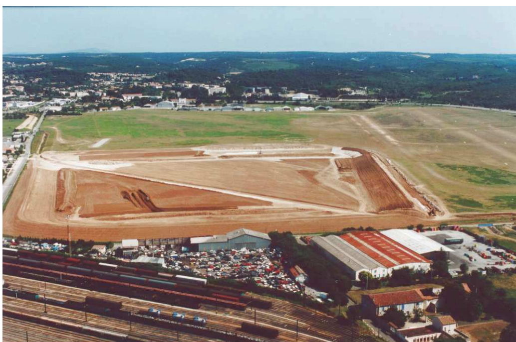
Vue aérienne de l'aérodrome ouest